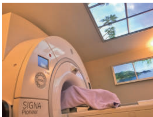
図5 頭部MRI検査と神経心理学的検査。

物忘れの脳神経外科臨床： 脳神経外科診療では、前期高齢者（65-74歳）、後期高齢者（75歳以上）が多数を占めている。地域の最前線の脳神経外科開業医ともなると、認知機能障害がらみの外来者が格段に増加している。ご本人からの相談にも増して、同居のご家族、遠方の娘さん息子さんから、あれこれ多くのお悩みを聞く場面が増える。問診ではなるべくご本人から生の声を伺う。MRI画像検査で頭脳の形態診断を説明して、MMSEなどの神経心理学的検査の結果を解説する（図5）。古いけど微小サイズの脳梗塞～隠れ脳梗塞が幾つか認められます。海馬の萎縮が少しありますが、年齢相応ですね。いやいや、隠れ脳梗塞が多々あるし、海馬萎縮も目立ち、要注意