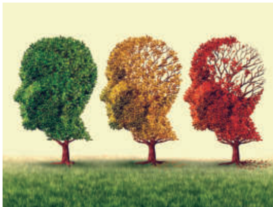
図2 物忘れの樹木：緑の葉あふれる健全な樹木、黄緑色の葉っぱがちらほらと混じるとMCI。養生次第で、緑の枝葉が茂るやも。黄色く枯れ始めると軽度認知症、赤く枯れて散り落ちると重度認知症。