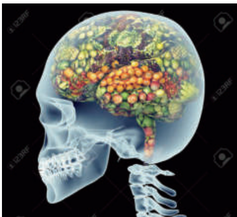
図1 新鮮な野菜でいっぱいの健康な頭脳。

頭脳健康: これからの超高齢化社会を迎えて、ひとびとの最大の関心事は、健康長寿に尽きる。お金が有っても無くっても、足腰が丈夫でひとりで歩いて、うまいもん喰って、お喋りができて、新しき事に興味を持って、いろんな事にチャレンジして、好きなことにも没頭する。健康とは、病気でないとか、弱っていないということではなく、肉体的にも、精神的にも、そして社会的にも、すべてが満たされた状態にあること (WHO 憲章)。つまり、肉体 (身) も精神 (心) も健全であるのが健康だ。とりわけ、司令本部の頭脳は、使えば使うほど脳内ネットワークが活性化され輝くと言われている。新鮮な野菜をいっぱい詰めて、実り多い知恵溢れる健康な頭脳がイチ押しだ (図1)。