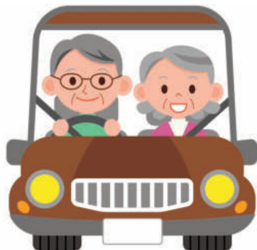
図4 空間認識力と注意力があれば車の運転はできるかも。

物忘れの端緒は気づきから： 物忘れの解決は気づきから始まる。物忘れかな?と思っても、いやいや歳のせい、歳を取ったら皆こうなるんだからと自問自答。ひとまずは忘却の彼方へと危機を消去しておく。この頃少し変